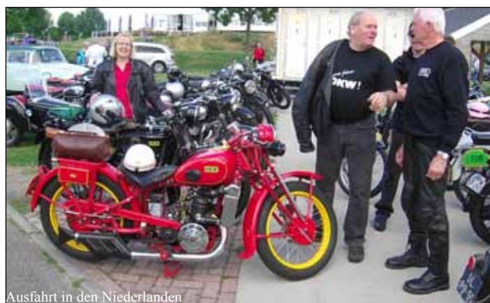
Ausfahrt in den Niederlanden

Dabei glänzen die DKW FREUNDE HARZ/HEIDE durch keinerlei Vereinsmeierei, es gibt keine Verpflichtungen. Wir sind kein eingetragener Verein, erheben keine Beiträge, es gibt keinerlei Formalitäten, selbst der Besitz eines DKW-Fahrzeugs ist keine Voraussetzung. Wer vorbeischauchen möchte, ist herzlich zu unseren Aktivitäten eingeladen.