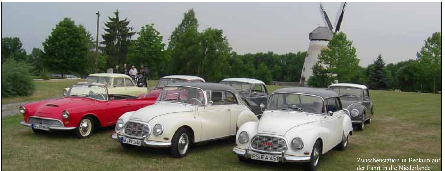
Zwischenstation in Beckum auf der Fahrt in die Niederlande