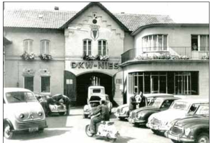
DKW-Nies in Braunschweig, Kramerstraße, um 1955