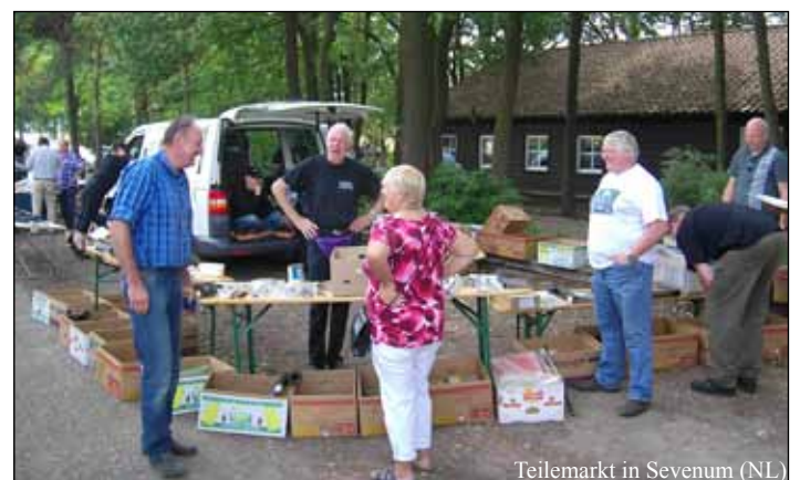
Teilmarkt in Sevenum (NL)

Auch private Teilmärkte wurden schon organisiert.