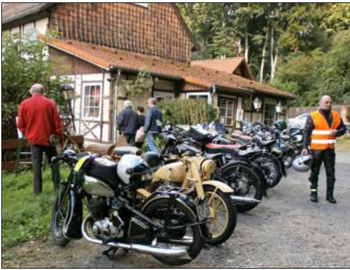
Am Watzumer Häuschen

„Bekannt aus Funk und Fernsehen“, selbst dieses Prädikat können wir für uns beanspruchen: für die Filme „Das Wunder von Lengede“ und „Ein Tag im Juni“ wurden DKW-Fahrzeuge gestellt. Fernsehaufnahmen von Aktionen der DKW FREUNDE HARZ/HEIDE wurden vom NDR und SAT1 gedreht und gesendet.