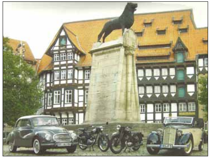
Plakatmotiv für das internationale Treffen 2004

Dabei wird die gemeinsame Anfahrt schon zu einem schönen Erlebnis und bietet nur recht selten Anlass zu gemeinschaftlichen Schrauberaktionen.