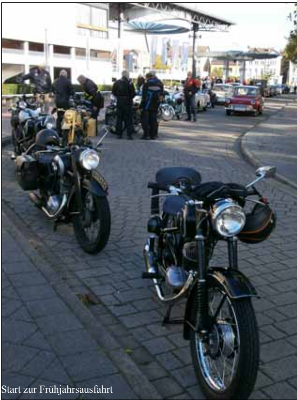
Start zur Frühjahrsausfahrt