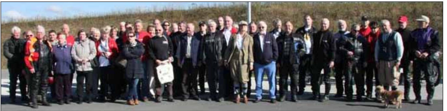
Ausfahrt zum Paläon